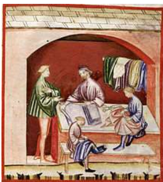
Tessitura della seta

Lectures: Atti 6, 1-7 Salmo 33(32) 1 Pietro 2, 4-9 Vangelo: Giovanni 14, 1-12